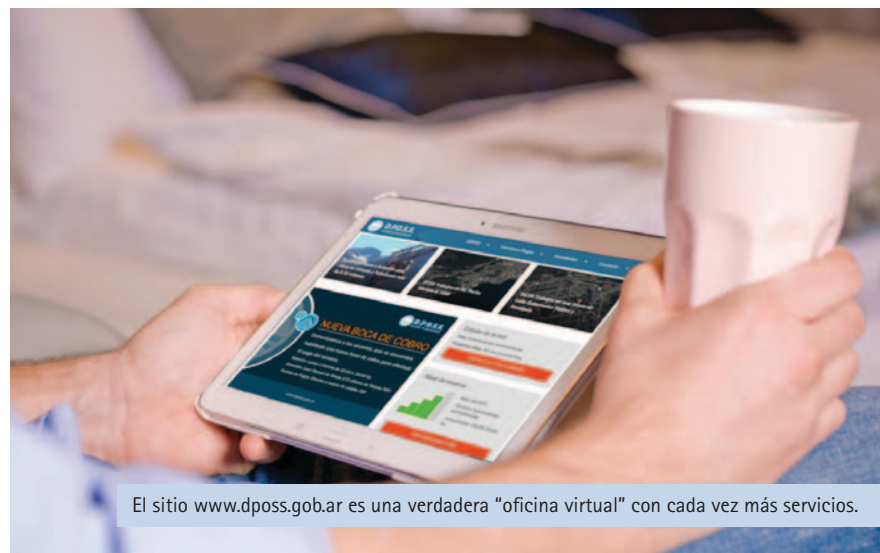
El sitio www.dposs.gov.ar es una verdadera "oficina virtual" con cada vez más servicios.

¿Consultas? ¿Reclamos? ¿Sugerencias? Tenemos un amplio abanico de vías de comunicación para vos.