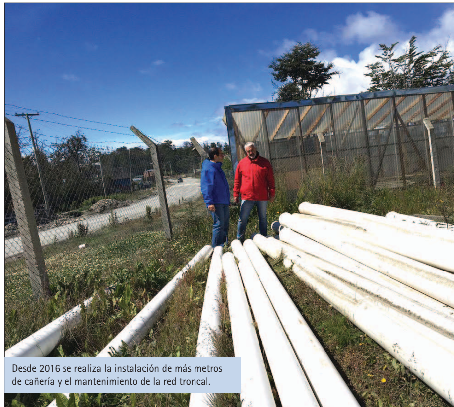
Desde 2016 se realiza la instalación de más metros de cañería y el mantenimiento de la red troncal.

De esta manera, la DPOSS emprendió el desafío de abarcar integralmente las dificultades sanitarias de Tolhuin, desde las condiciones básicas para que los trabajadores realicen sus tareas hasta el desarrollo de la complejidad de la obra pública.