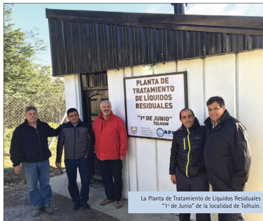
La Planta de Tratamiento de Líquidos Residuales "1° de Junio" de la localidad de Tolhuin.

Con el cambio de administración política en el Gobierno de la Provincia,