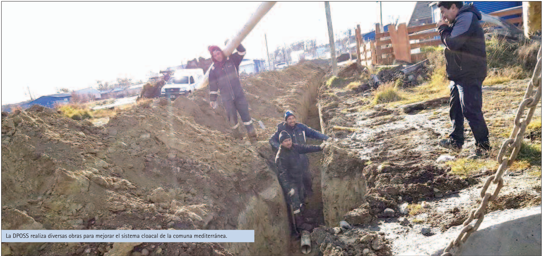
La DPOSS realiza diversas obras para mejorar el sistema cloacal de la comuna mediterránea.

en 2016 se encaró un plan exhaustivo en el marco de la decisión política de priorizar la instalación de servicios básicos, primero con tareas de mantenimiento de la red troncal, la puesta en marcha de la planta, la instalación de más metros de cañerías y el llamado a licitación para obras tendientes a terminar con el problema del volcamiento a la vía pública de efluentes cloacales, canalizándolos hacia una planta modular trasladada desde Río Grande.