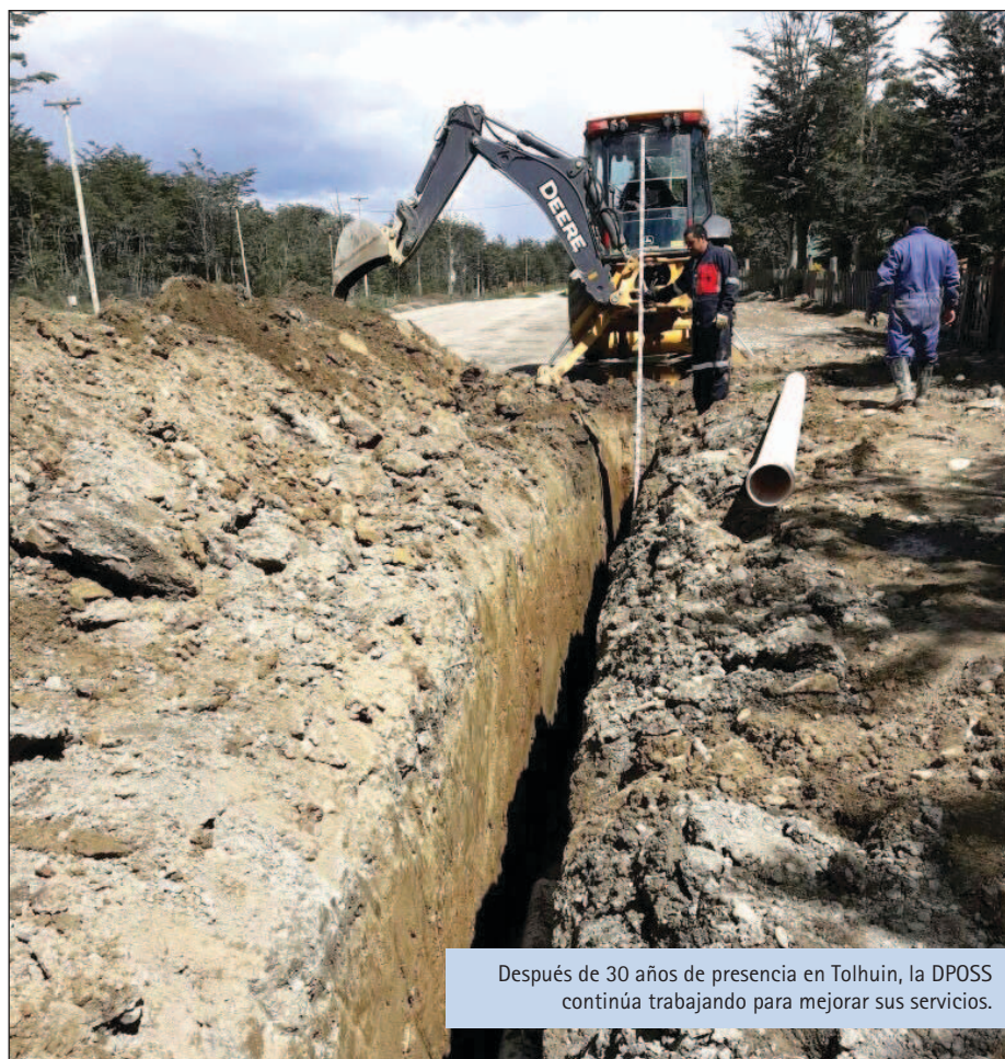
Después de 30 años de presencia en Tolhuin, la DPOSS continúa trabajando para mejorar sus servicios.

Las instituciones públicas siempre han acompañado la historia de los pueblos. Aquí, un breve repaso, desde la entonces Dirección Territorial de Obras y Servicios Sanitarios a la actualidad.