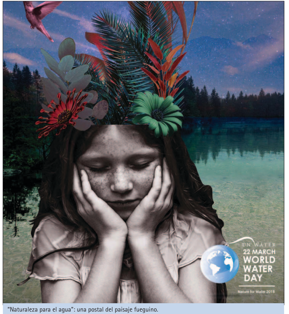
"Naturaleza para el agua": una postal del paisaje fueguino.