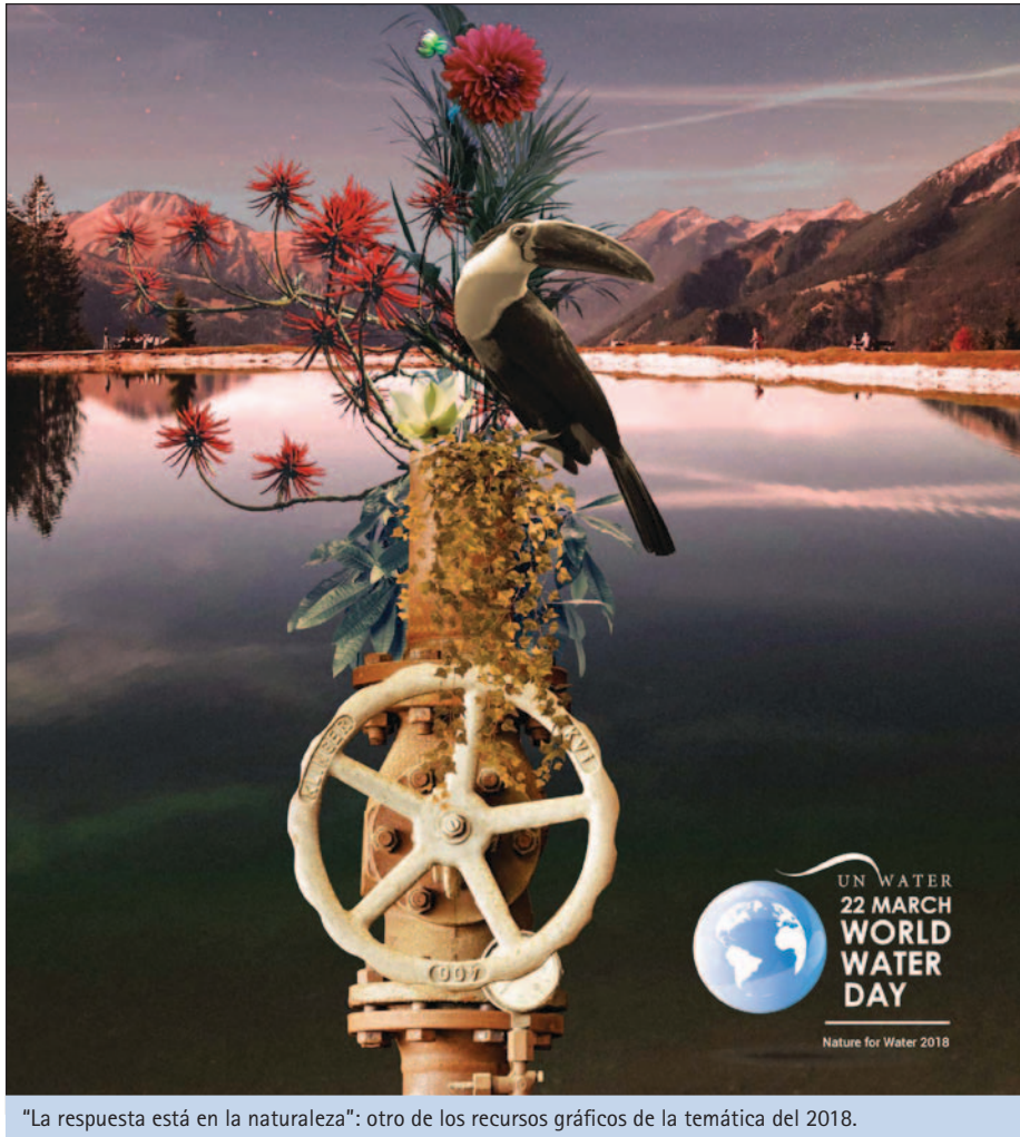
"La respuesta está en la naturaleza": otro de los recursos gráficos de la temática del 2018.