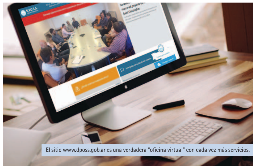
El sitio www.dposs.gov.ar es una verdadera "oficina virtual" con cada vez más servicios.

¿Consultas? ¿Reclamos? ¿Sugerencias? Tenemos un amplio abanico de vías de comunicación para vos.