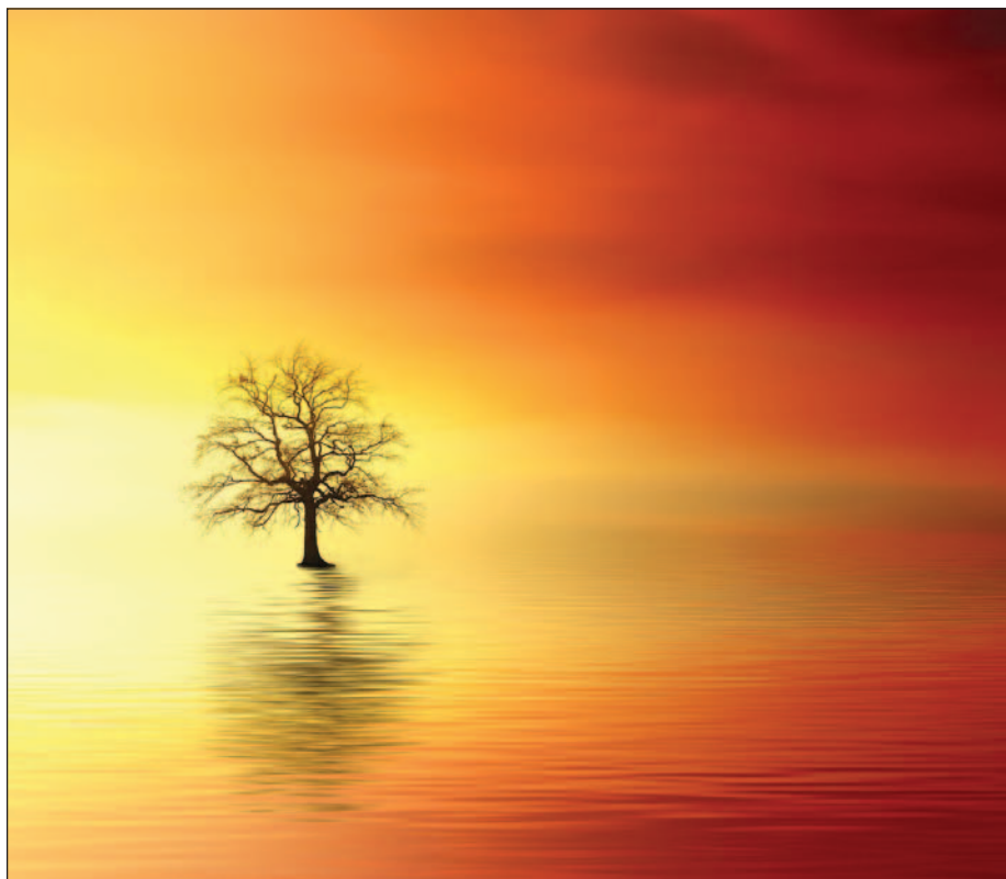
"Naturaleza para el agua", el tema de este año del Día Mundial del Agua.

La necesitamos para vivir, para prosperar, para salir de la pobreza. Por primera vez abordamos en estas páginas el tema del Día Mundial del Agua, una invitación para reflexionar sobre la conservación, el desarrollo y el buen uso de los recursos hídricos en todo el mundo.