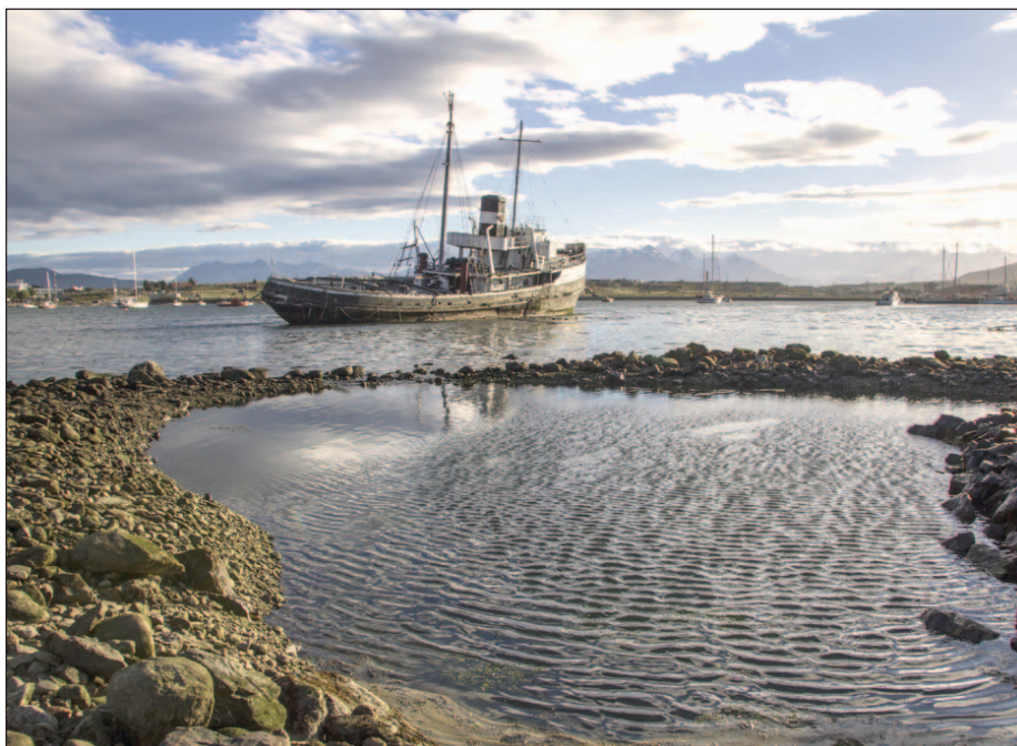
El patrimonio histórico y cultural también hace al desarrollo de las ciudades.

Las gestiones de gobierno pueden dejar muchas obras nuevas para las generaciones futuras, pero también deben tener la capacidad de recibir el patrimonio histórico y cultural de una comunidad, preservarlo, ponerlo en valor, para luego entregarlo de la misma manera a quienes vendrán. Y con esto no nos referimos al próximo gobernador o intendente, sino a nuestros hijos y nietos.