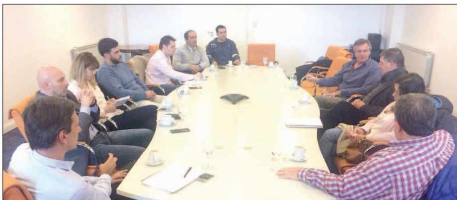
Representantes de distintos sectores de la comunidad aseguraron que el proyecto para rescatar la embarcación los "apasiona".

En el marco del proyecto para salvar al barco, se realizó una reunión de la que participaron especialistas que resaltaron el carácter único del mismo. También estuvieron presentes referentes del turismo y funcionarios del área de Cultura.